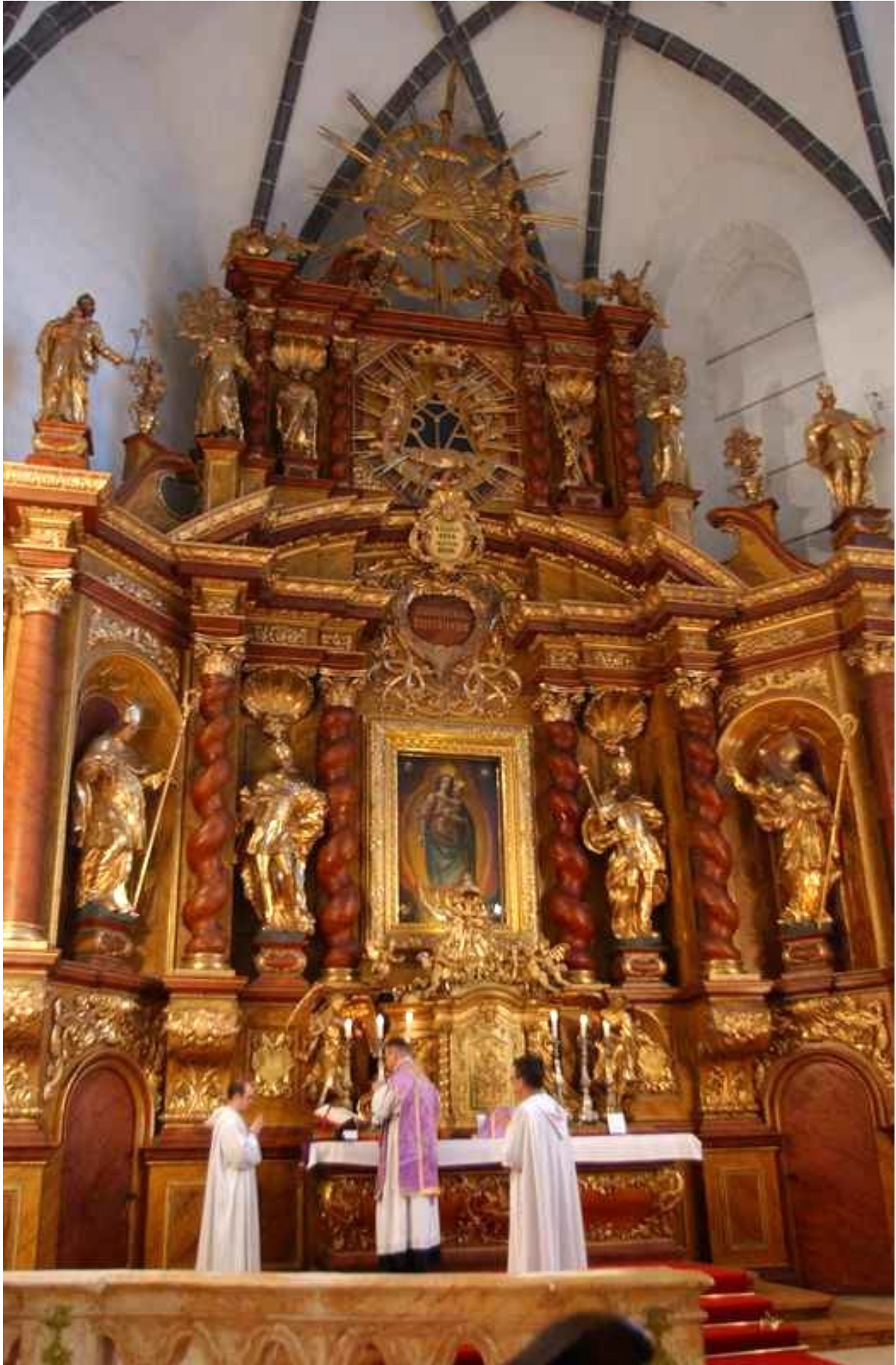
Alácsi Ervin 2011-es tridenti miséje a szegedi alsóvárosi ferences templom főoltáránál