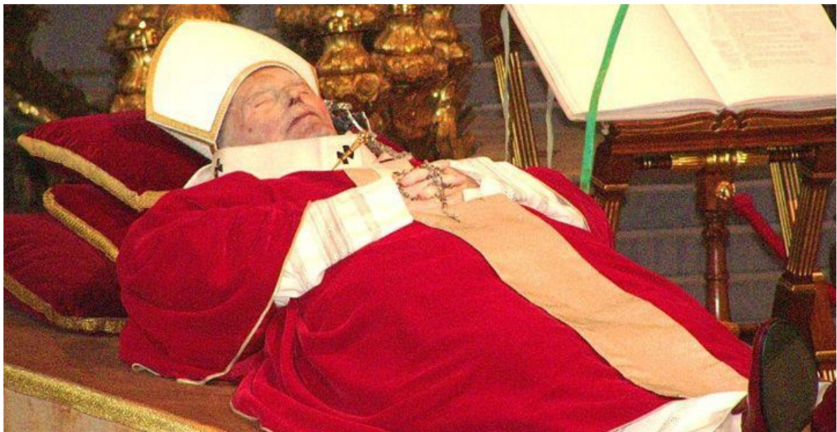
II. János Pál pápa felravatalozva