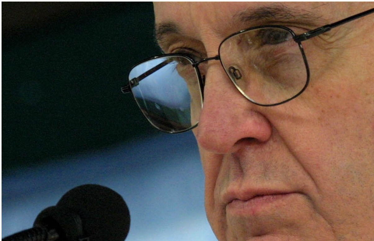
Ferenc pápa, azaz Jorge Mario Bergoglio tekintete, mely az isteni szándékokat fürkészi

Ez még rázósabb talány, ha egyáltalán vannak ilyen tervek és vágyak. Ennél két lehetőséget is el tudok képzelni: 1./ Vissza lehet térni a bizánci rítusról az antiochiaira. A 8. század előtt még a Jakab liturgiát használta az ortodoxok zöme, azután tértek át az Arany-szájú Szt.János liturgiára. Manapság a Jakab liturgiát csak évente egyszer, Jakab apostol ünnepén használják. De még ígéretesebbnek tűnik számomra a nemrég, a 90-es években kifejlesztett nyugat-szír, latin nyelvű miserítus, amit az Európai Független Ortodox Egyházak Tanácsa használ. Ez olyan feltűnő kísérlet, mint a lutheránusoknál az 1997 óta használt Tamás mise, amit keresőknek szánnak. Úgy néz ki, hogy az ortodoxoknak, főleg az unionistáknak, a görög-katolikusoknak alapvető beleszólása lesz a katolikus liturgiába. A pápák ugyanis nem mondtak le az ortodoxokkal való unió lehetőségéről, ami már először 1439-ben, majd 1490-ben felső, formális szinten létre is jött, csak éppen hamar szétesett, nem sikerült átvinni a gyakorlatba, de ezért sok minden okolható. Mindenesetre ezt már a nemrég megválasztott pápa, Jorge Mario Bergoglio fogja majd eldönteni. A liturgia területe ugyanis hagyományosan pápai felségterület, s az is marad.