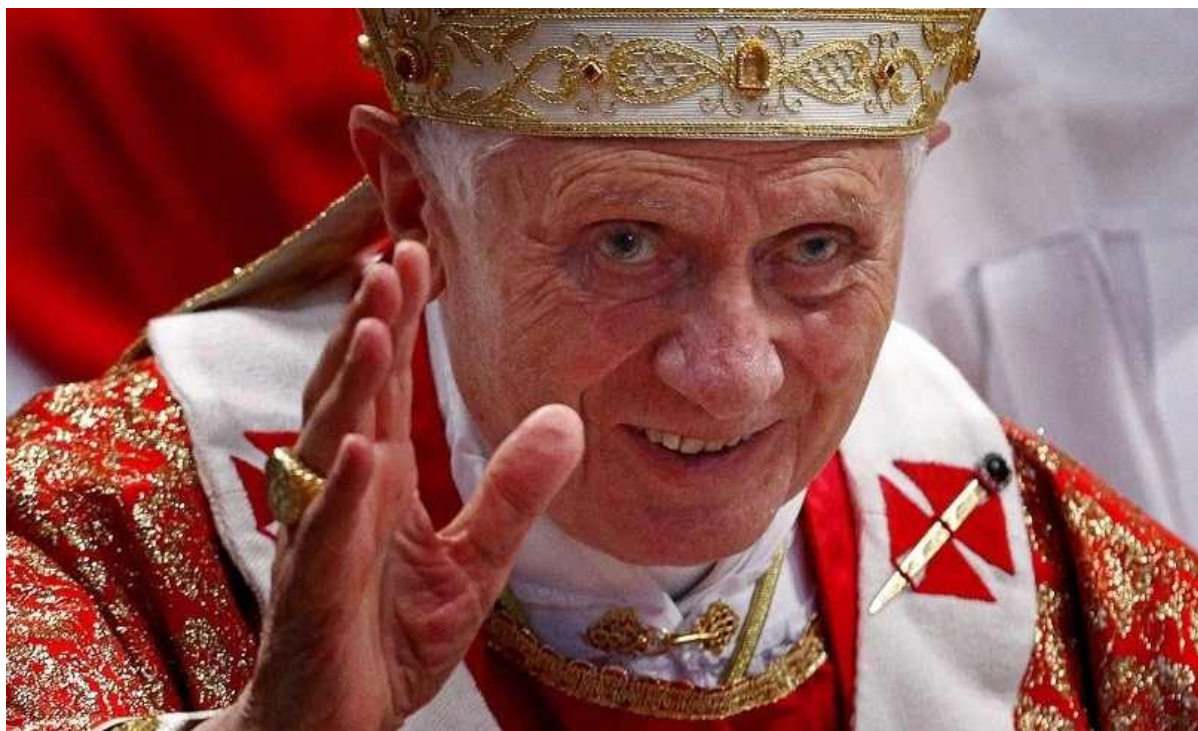
XVI. Benedek pápa áldása